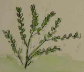
Bruno (8 años) 1er. grado