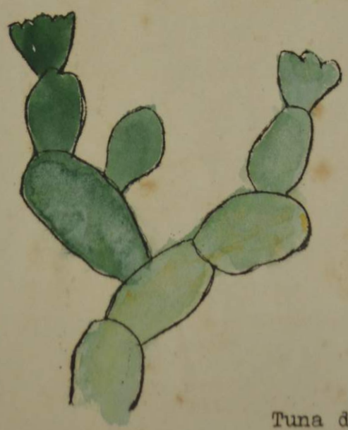
Tuna del barranco