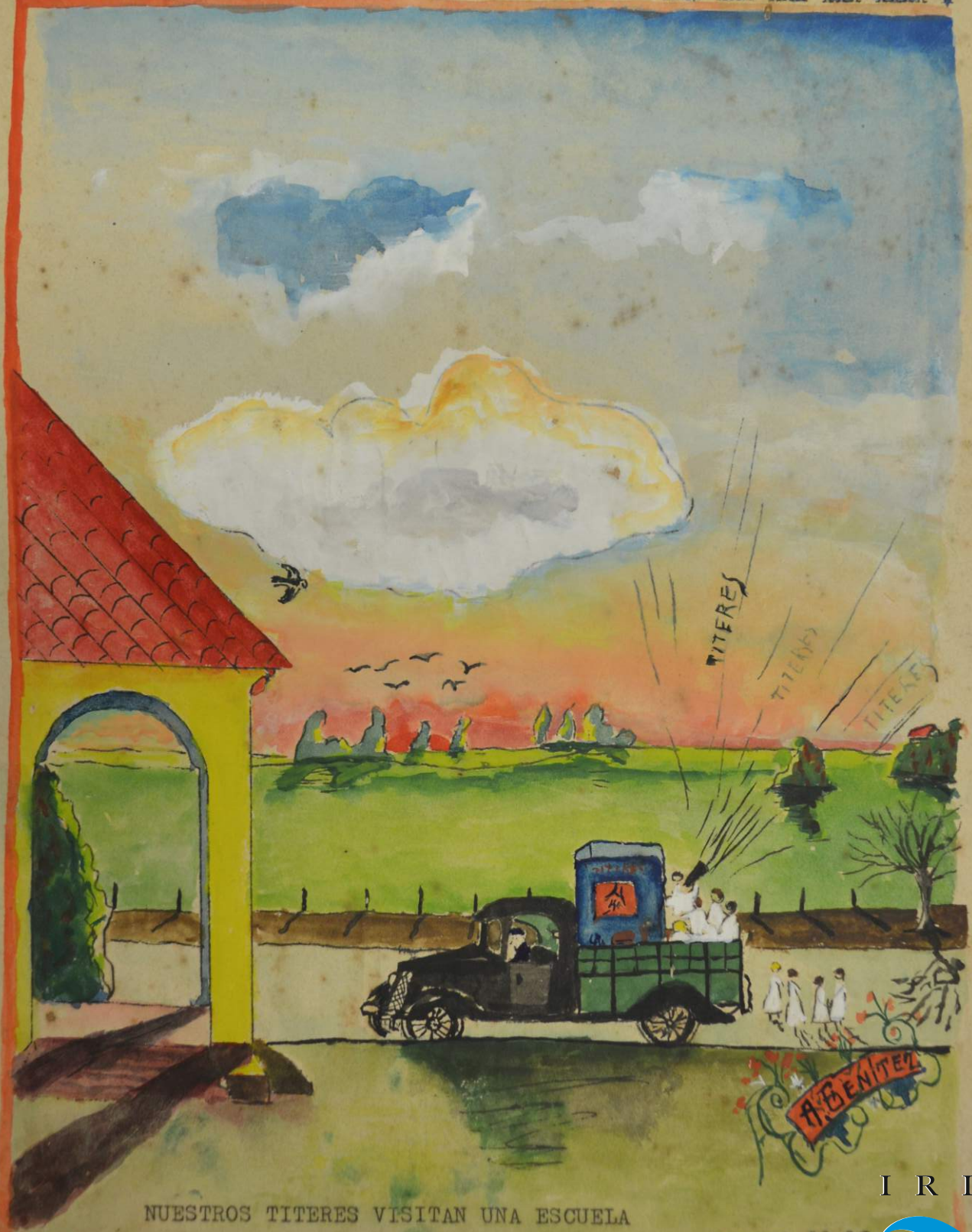
NUESTROS TITERES VISITAN UNA ESCUELA